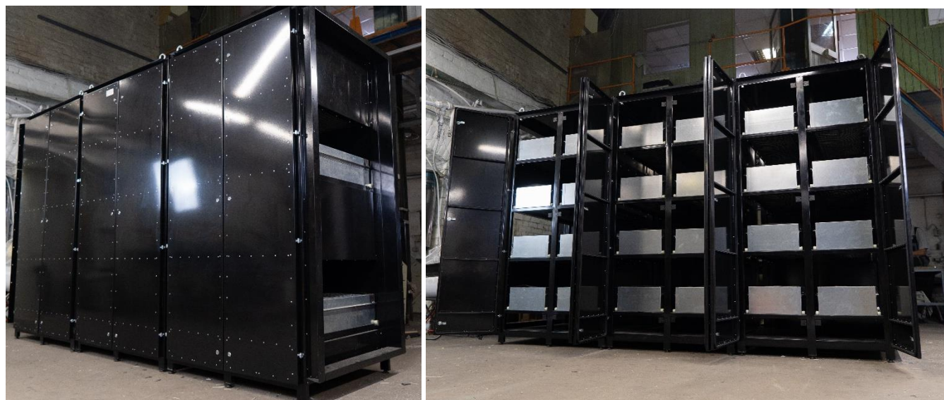
Фото готовой продукции

Чертежи с габаритно-присоединительными размерами высылаются по запросу.